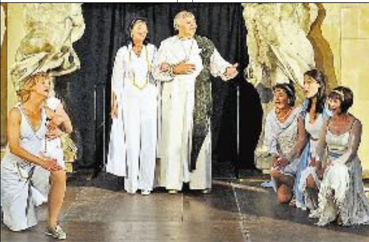
Egal, ob im Knappenhof oder im Kulturzentrum - die heurige Produktion der Knappenhofoper durch die Perchtoldsdorfer Franz-Schmidt-Musikschule mit Offenbachs „Orpheus in der Unterwelt“ ist kurzweilig und von durchaus beachtlichem Niveau!